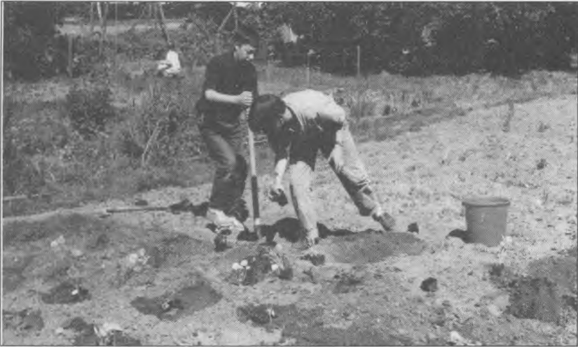
Le travail de la terre, un bienfait pour les enfants